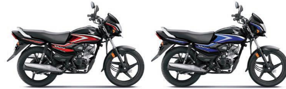
रेड के साथ ब्लैक ब्लू के साथ ब्लैक